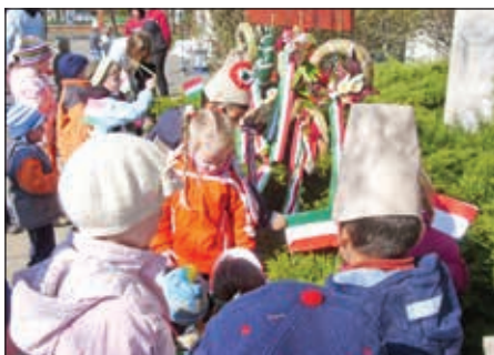
Koszorúzás március idusában