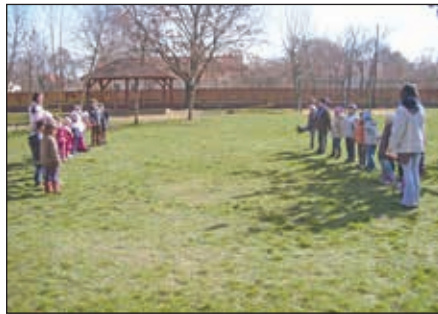
Adj király katonát! – huszárosan

Hortobágy Község Önkormányzata 2014. május 31-én, szombaton várja a településünk lakóit a Hortobágyi Falunapra. A reggeli felvonulást – amely mint minden évben a Titi Éva Faluháztól indul – ünnepélyes megnyitó, majd az óvodások és az iskolások fellépése követi. A főzőverseny már a reggeli helyfoglalást követően elindul, de a zsűri csak délben fog az ízléshez.