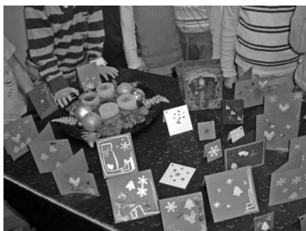
Óvodai életképek a 2009/2010. tanévből...